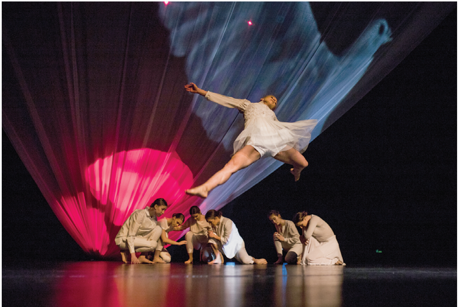
Šokis visada pakylėja. Kaip ir viltis...