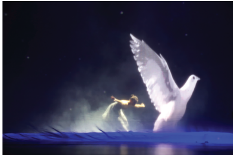
Sustabdyta koncerto akimirka.