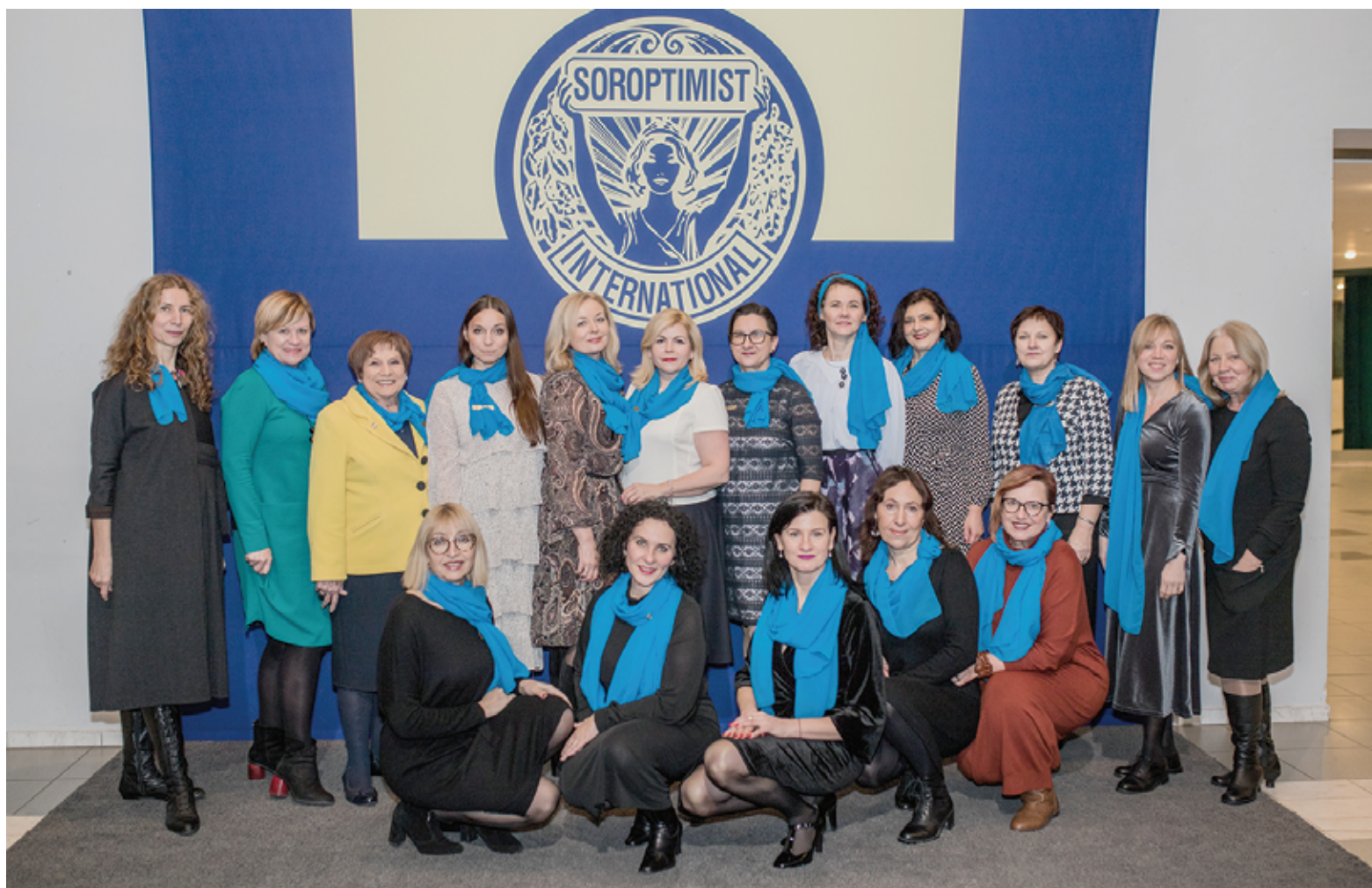
Alytaus soroptimisčių klubo narės.