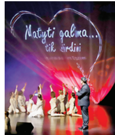
„Matyti galima... tik širdimi“ labdaros koncerto idėją padiktavo Antoine'o de Saint-Exupery knyga „Mažasis princas“.