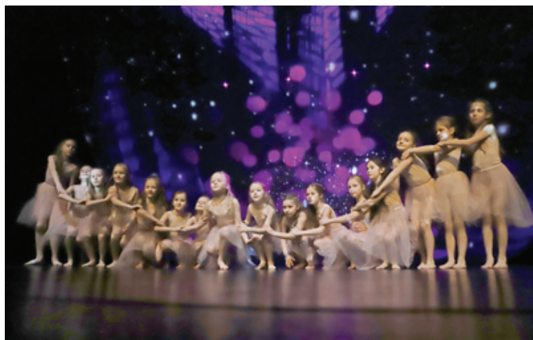
Ačiū visiems, prisidėjusiems, kuriant šį jautrų renginį.