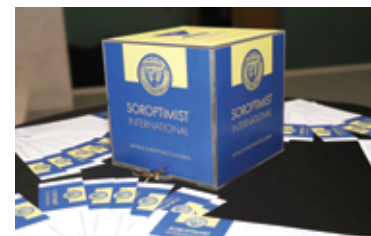
Adrijaus gydymui žiūrovai aukėjo ir labdaros koncerto metu.